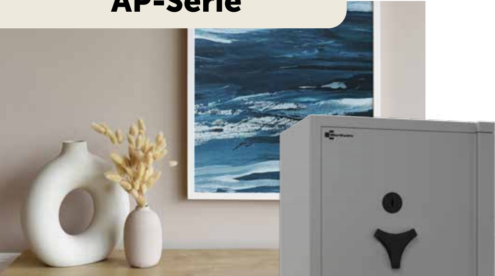
Tresor AP15 Farbe: Grey Türbandung: rechts Schlüsselschloss Wittkopp 2648