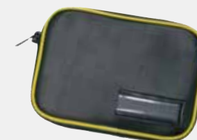
Abb. Einwurf tasche