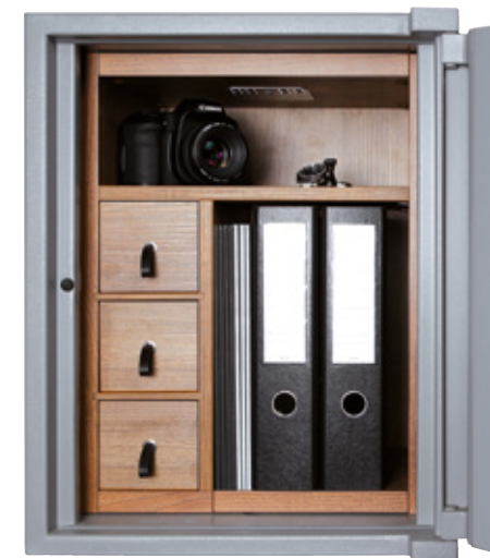
Abb. Holzeinrichtung ALZ007200